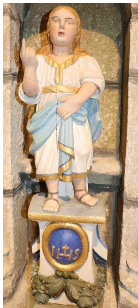
Enfant Jésus 17ème siècle

Le chantier a concerné la couverture, avec la pose de gouttières, la maçonnerie côté Nord, la charpente de la sacristie et le rénovation complète de l'installation électrique et de l'éclairage. En outre le mobilier, les trois autels et les treize statues ont été restaurés.