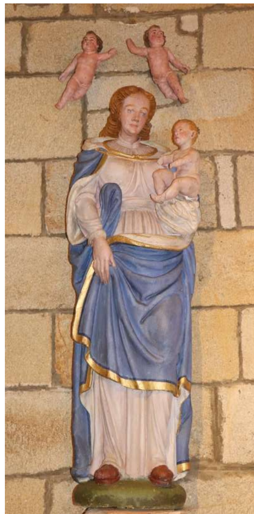
Vierge à l'enfant 17ème siècle

La chapelle sera ouverte pour les offices, les concerts, le dimanche pendant l'été et pour les journées du patrimoine