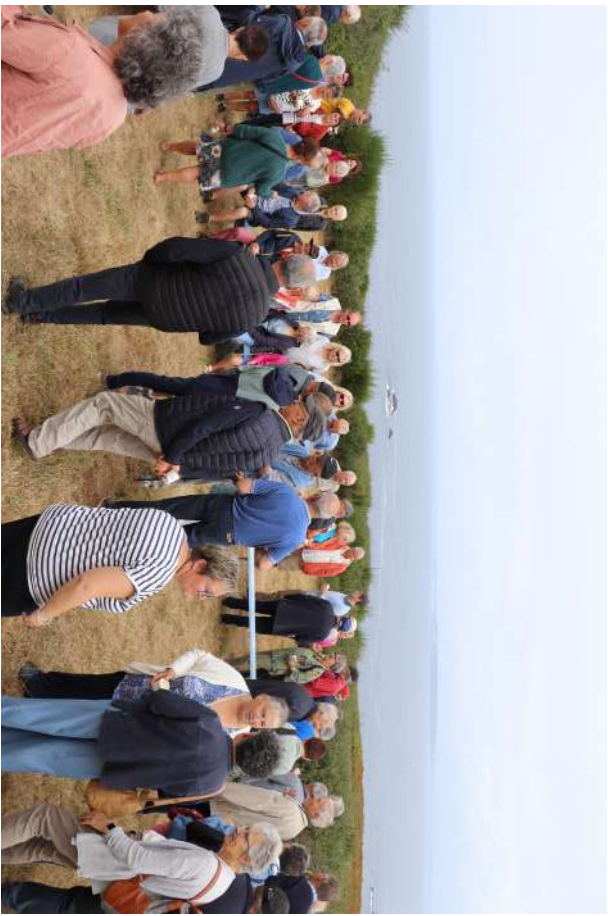
Ti Felix 27 Juillet 2025