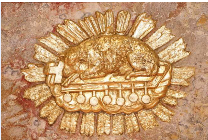
Agneau doré du maître autel

Les travaux sont quasiment terminés, reste à restaurer la statue de la vierge dorée.