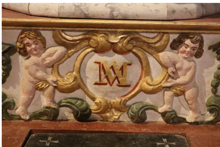
Ornements du maître autel