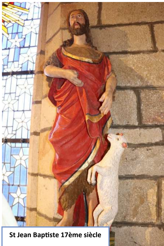
St Jean Baptiste 17ème siècle