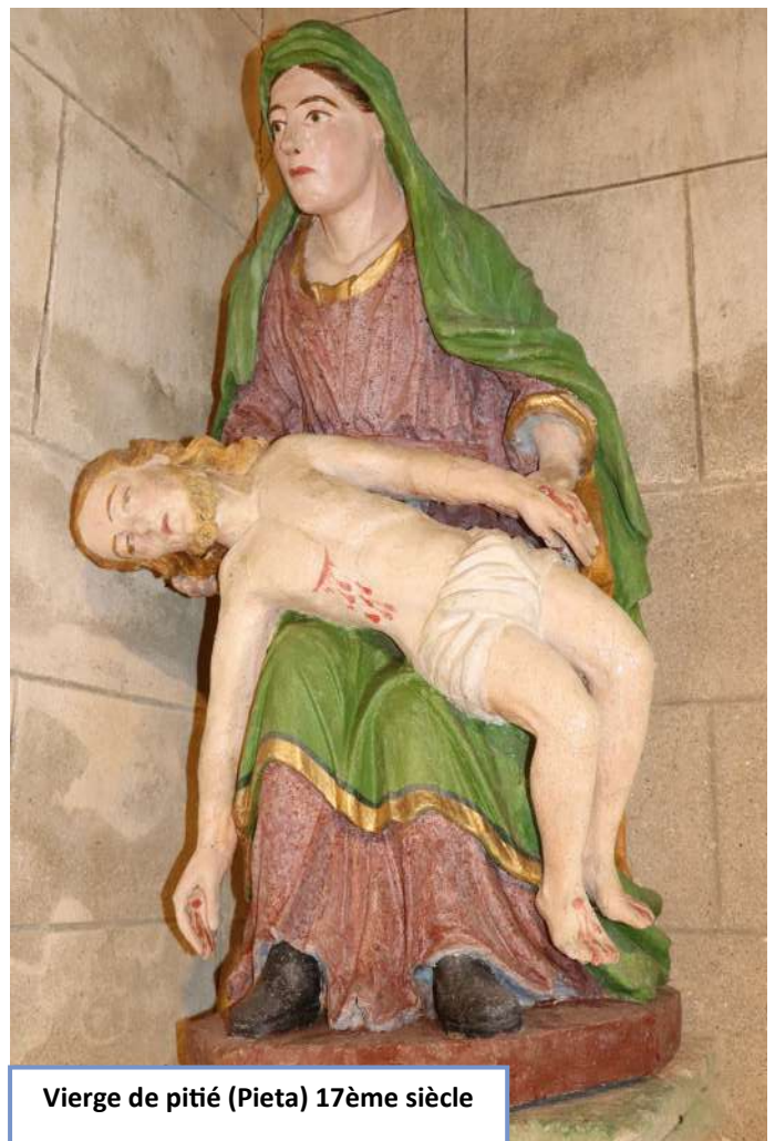
Vierge de pitié (Pietà) 17ème siècle