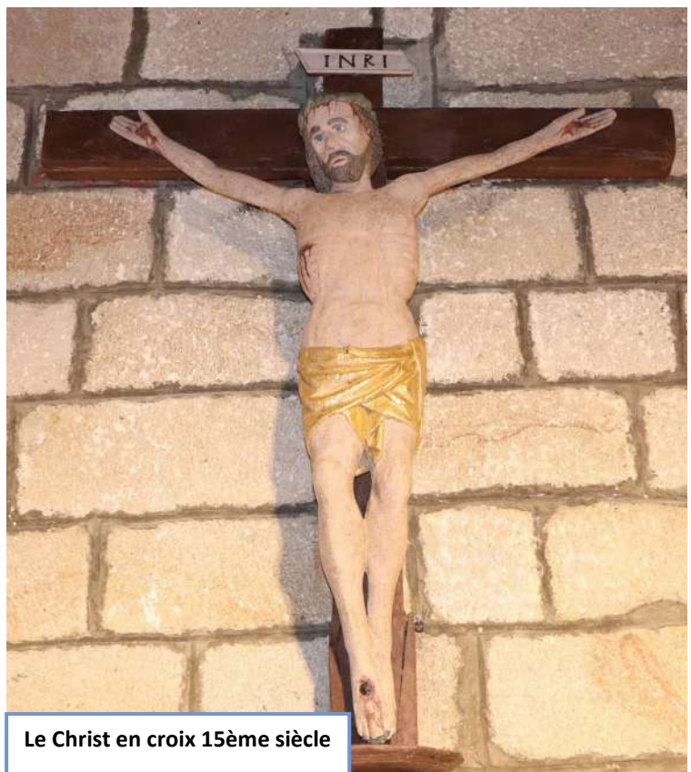
Le Christ en croix 15ème siècle