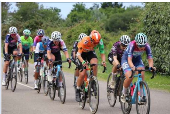
Pointe du Raz ladies classic