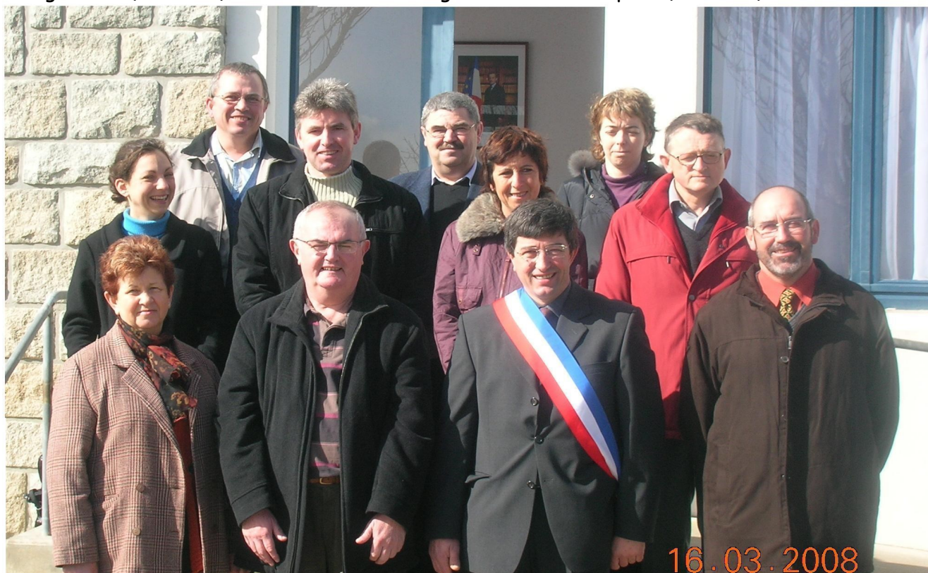
De haut en bas et de gauche à droite :